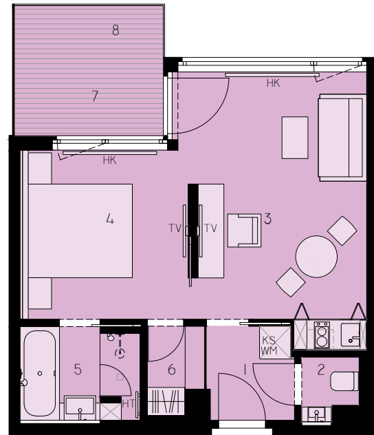
TOP 16 CA. 37,98 M 2