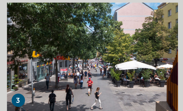
1 - 2 | Nahgrünzone Haydnpark 3 | Flaniermeile Meidlinger Hauptstraße