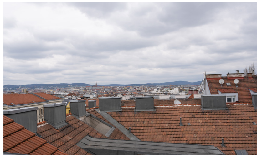
HERRLICHE AUSBLICKE ÜBER WIEN: DIE DACHGESCHOSSEINHEITEN BIETEN EINDRUCKSVOLLE SICHTACHSEN MIT FLAIR.