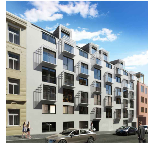
MATZNERGASSE 10-12, 1140 WIEN